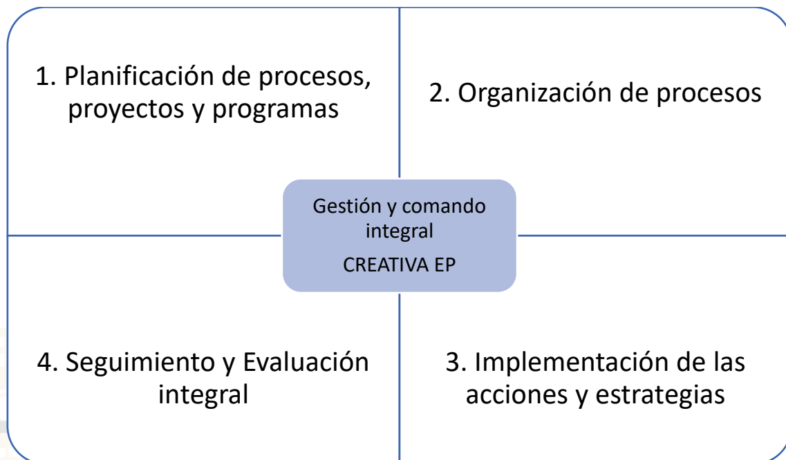
Figura 1. Ciclo de la gestión implementada en CREATIVA -EP.

La gestión de CREATIVA – EP, parte de la teoría de la Gestión por Resultados (GPR) basada en el siguiente esquema: